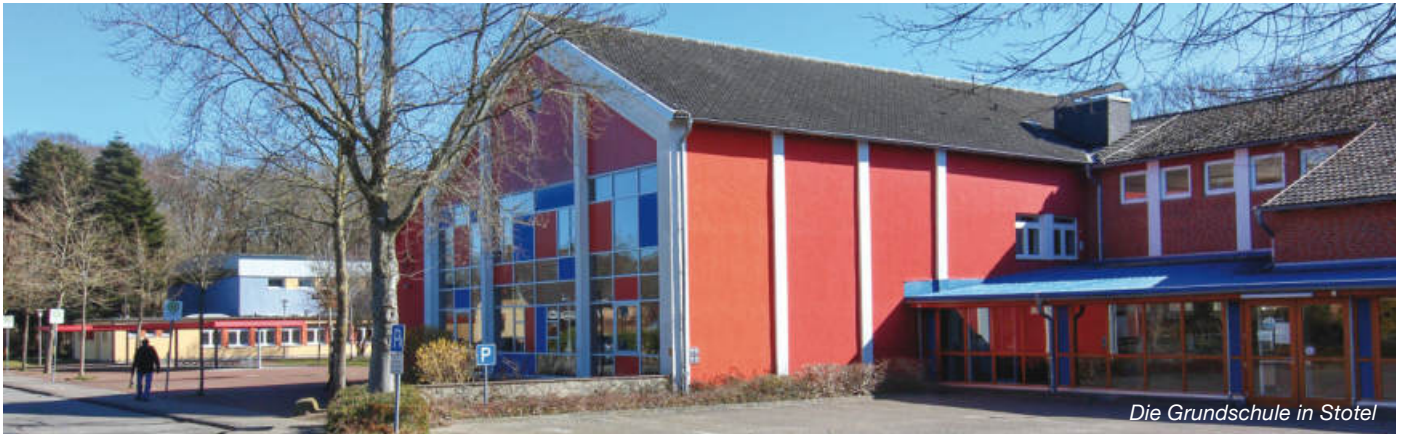
Die Grundschule in Stotel