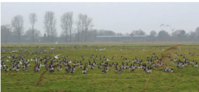
Die Nonnengänse verursachen erhebliche Schäden