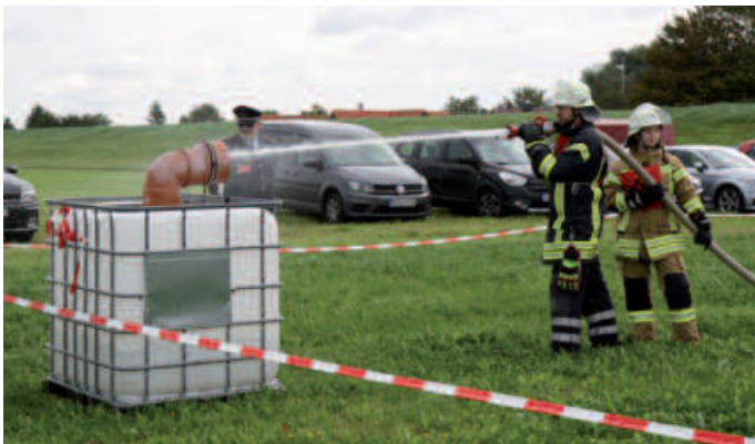
Tank mit Wasser füllen

Der Leistungsvergleich der Einsatzabteilungen und der Leistungswettbewerb der Jugendfeuerwehren der Gemeindefeuerwehr Loxstedt wurden in diesem Jahr durch die Ortsfeuerwehren Dedesdorf und Wiemsdorf im August ausgerichtet. Wegen des aufgeweichten Marktplatzes in Dedesdorf wurden sie mit Absprache mit dem Deichverband und einem Bewirtschafter auf den Außendeich vor Eidwarden verlegt. Es wurden die Einsatzfahrzeuge und Gäste von der Fährstraße auf dem Treibselräumweg bis zur Überfahrt Eidwarden geleitet. Die Fahrübungen haben in der Ortschaft Wiemsdorf stattgefunden. Natürlich hatten die Ausrichter auch für Kaffee und Kuchen in einem Zelt und Bratwurst und Pommies sowie einen Getränkestand gesorgt.