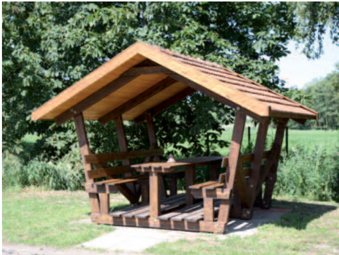
Die neue Sitzhütte an der Alten Deichstraße