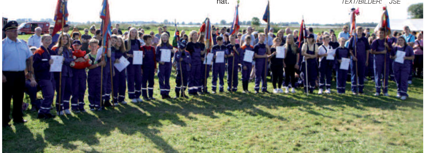
Siegerehrung bei den Jugendfeuerwehren