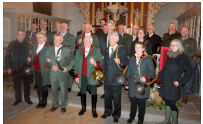
Die beiden Bläsergruppen im Altarraum