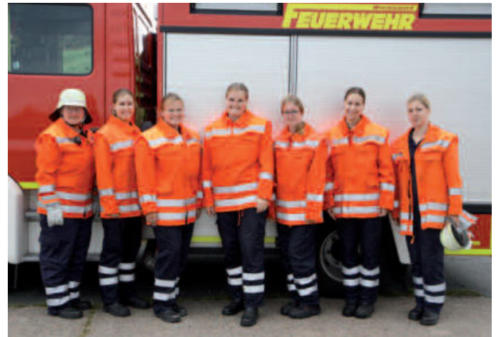
Damengruppe aus Wiemsdorf

Auf mehreren Bahnen wurden die einzelnen Module des Leistungsvergleiches unter den fachkundigen Augen der Wettbewerbsrichter und der zahlreichen Zuschauer durchgeführt. „Ich bin mit der gezeigten Leistung zufrieden und danke den Ausrichtern für die gute Vorbereitung des Wettkampfpplatzes“, erklärte Jens Dornis zum Abschluss des